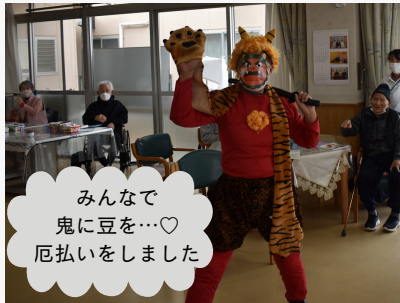
みんなで 鬼に豆を…♡ 厄払いをしました